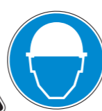
Protección obligatoria de la cabeza