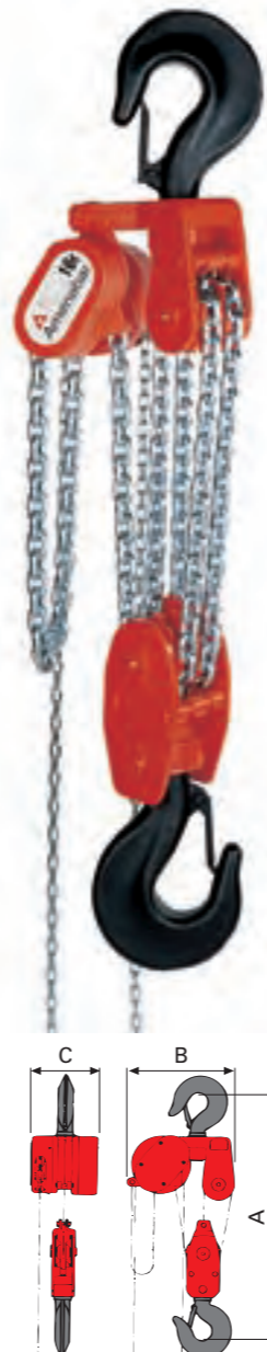
4 y 5 Ramales de 12.500 Kgs. y 16.000 Kgs.