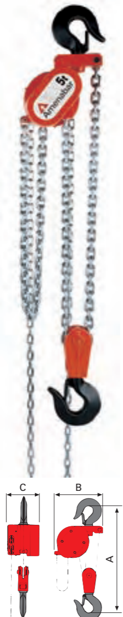
2 Ramales de 3.200 Kgs. a 6.300 Kgs.