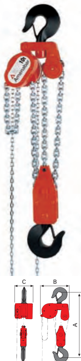
3 Ramales de 8.000 Kgs. y 10.000 Kgs.