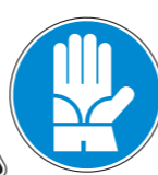
Protección obligatoria de las manos