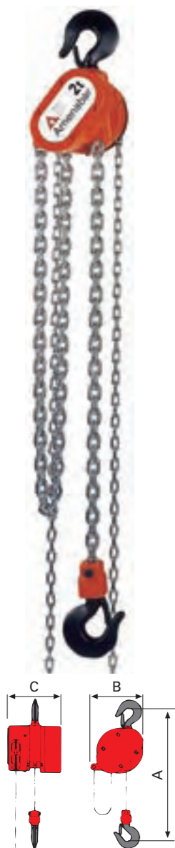
1 Ramal de 250 Kgs. a 2.000 Kgs.